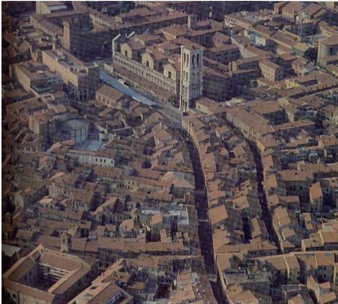
Via Mazzini, amely a centrum teréhez, az Este-kastélyhoz vezet

Gazdag kulturális programok gazdagítják a város életét, de a lakosság legnagyobb része nem látogatja ezeket, a lélekszámhoz viszonyítva csak igen szűk réteget érint... S hogy ki miért nem, erre mindenkinek megvan a magyarázata - kivéve a felkapott sztárokhoz, nagy hírességek nevéhez fűződő rendezvényeket, oda viszont egy «egyszerű földi halandó» nehezen kap jegyet, vagy egyáltalán nem... 2