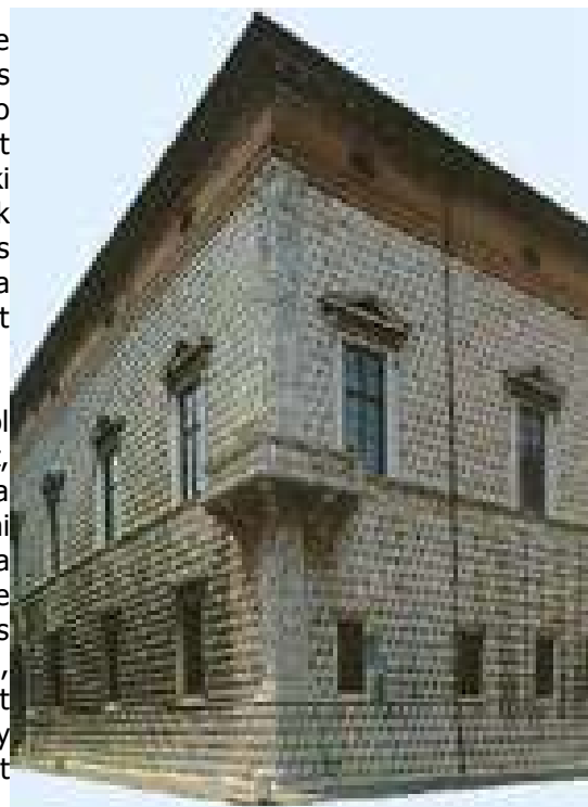
Palazzo dei Diamanti

Az idegen, legyen az külföldi, vagy más tartományból érkező azonnal megérzi a ferrarai közösség zártságát, ridegségét: nehezen fogadja be az idegeneket. Ennek a talán genetikailag is átörökített magatartásnak történelmi magyarázata van: azt mondják, hogy a ferraraiak a hollandokhoz hasonló karakterek. A földjük nem jelentette a Természet Anyát, a «Madre Naturát», mindenegyes darabkát úgy kellett e népnek apránként megkaparintania, meghódítania a tengertől és a posványoktól. S ehhez jött az örökös küzdelem a Pó áradásaival, amelyek igen nagy káros következményekkel jártak: nyomorúságot, halált hagya hátra.