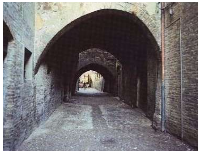
Via delle Volte

Ferrara történelmi városmagja, ahonnan elindul a bizánci kori védő városfalépítés