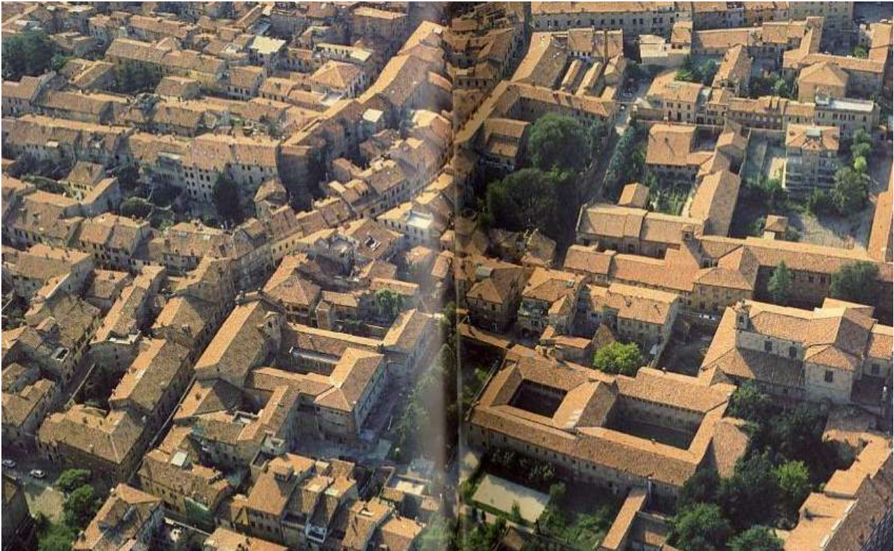
A Via Saraceno városnegyede