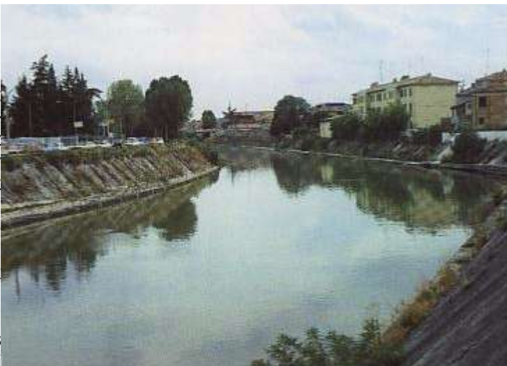
A jelenlegi Po di Volano S. Giogionál

Ebben az ékben, a IX és XI. század között épült Ferrara Szt. Györgynek (S. Giorgio) – aki egyébként Ferrara védőszentje - ajánlott katedrális (ld. a cikk végén). Ezen esemény előtt, s még a város első középkori magjának kialakulása előtt (VII. sz.) e területen vezetett egy fontos római út, amely Dél-Venetót Ravennával kötötte össze. Erről a Garibaldi utca alatti talált régészeti leletek tanúskodnak. Ez az út átszelte a Pót, S. Antoniónak (Szt. Antal) nevezett folyami szigetet, ahol alacsony volt a folyó vízállása, s ez megkönnyítette a folyón keresztüli