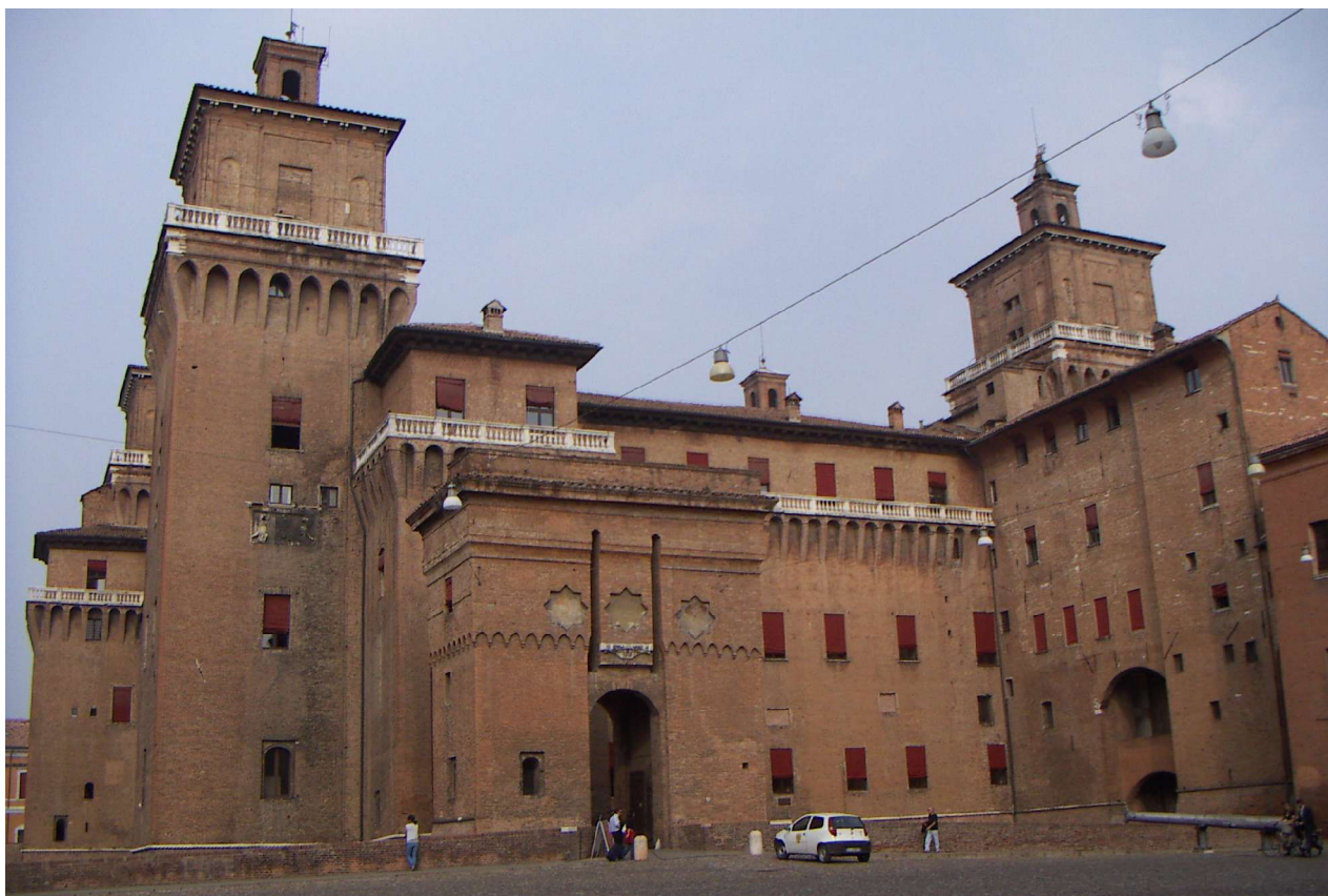
Este-kastély: Fotó © B. Tamás-Tarr Melinda

film, valamint Giorgio Gandini 1994-ben publikált könyve, amely a «La notte del terrore», azaz «A terror éjszakája» címet viseli.