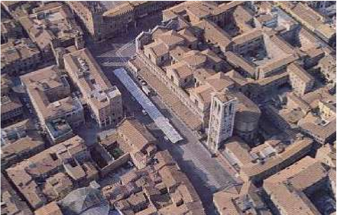
Piazza Trento Trieste