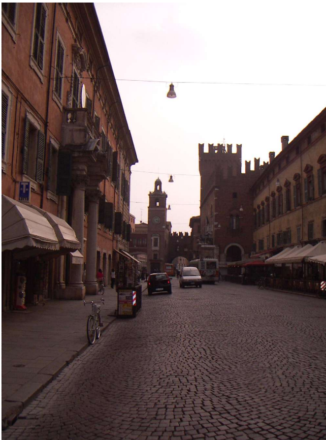
Mártírok útja, jobbra kicsit fozzánk közelebb van a nem látható kastély és ennek az oldalán történt a fenti gyilkosság.

Valóban nehéz elképzelni a komor kastélyban Lucrezia Borgiának, Alfonso D'Este nejének színes udvarát, aki híres volt intellektuális képességeiről is nemcsak szépségéről, s aki szívesebben tartózkodott a város délkeleti szegélyén fekvő Palazzo Schifanoiában, azaz a Gondúzó palotában, amelynek falait a már említett Francesco del Cossa és tanítványai freskói díszítik.