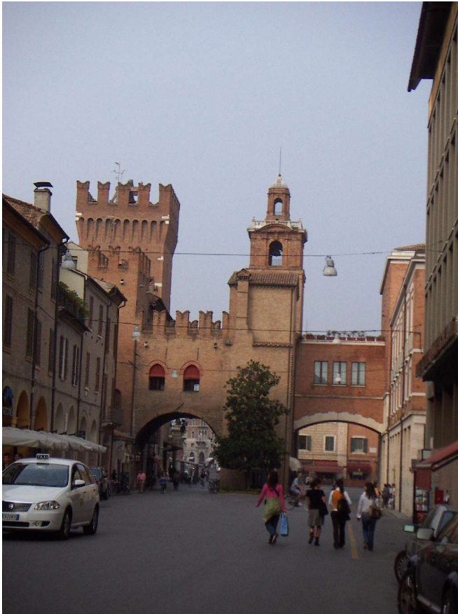
Porta Reno út

nagy páras forráságtól; fojtogatottak az Uraságok despotizmusától, akik a kurtizánokat és a jószágokat szerették és a szabadság után áhítózó embereket gyűlölték.