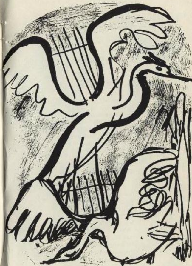
Illustrazione di Erszébet Pásztor / Illusztráció: Pásztor Erszébet