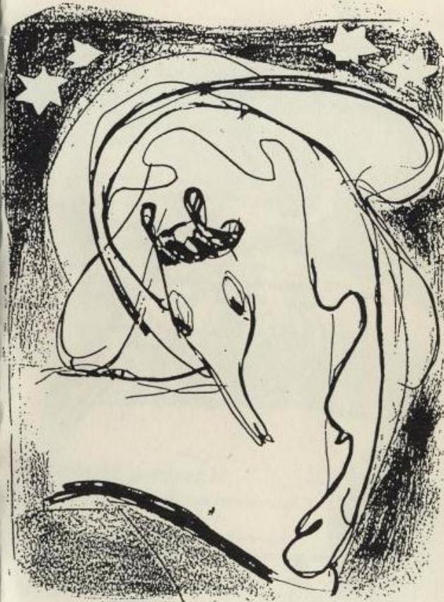
Illustrazione di Erszébet Pásztor / Illusztráció: Pásztor Erszébet