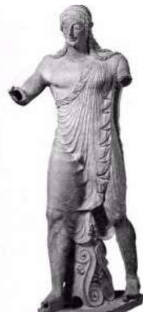
1.) Volterrai etruszk árkádos kapu. Az árkád alkalmazása az etruszk építészetben nagy újdonság volt. 2.) Az ún. „Fátyolos Apolló”, kb. Kr. e. 500 körül.

Keveset tudni az etruszkok politikai szervezetéről: nem volt egy egységes állam, több független város alkotta, amelyek egymás között szövetségben álltak. A kezdeti időkben (kb. Kr. e. 600 körül) voltak vezetőik, az ún. lucumoni , akik Etrúria legfőbb városi elöljárói voltak, akiknek néhány város felett volt hatalmuk; majd Kr. e. 500 körül megdöntötték a monarchiát és a városok kormányai különösen gazdag és erős emberek csoportjainak a kezébe kerültek.