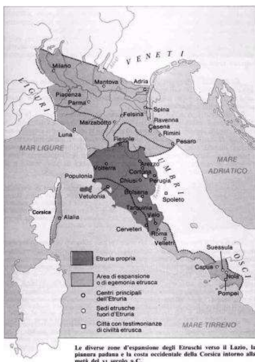
A különböző etruszk kiterjedések Lazio felé, a Pó-síkságon, Korzika területén Kr. e. VI. sz. felében.

A kutatók arról panaszkodnak, hogy sajnos hiányzik az irodalmi hagyomány, annak ellenére, hogy biztos, hogy a félsziget ókori lakóinál megszokott tevékenység volt az írás, csak hogy elveszett a latin és a helyi nyelvek elterjedése következtében. Az ősi etruszkokkal kapcsolatban is rengeteg régészeti emlékekre bukkantak a kutatók, s ezek segítségével az életük és civilizációjuk számos aspektusát megismerhetjük, valamint betekintést nyerhetünk az ókori művészet kifejezésvilágába, amelyek számunkra egyébként teljesen vagy részben ismeretlenek lennének. Gondoljunk csak arra – a példa kedvéért –, hogy a görög festészet majdnem teljesen megsemmisült, s most, hogy adott az a tény, hogy az etruszk művészet a görög egyértelmű elágazása, nyilvánvaló Etrúria és a máshol talált sírleletek rendkívüli fontossága, mivel mindezek lehetővé tették a pontosabb ismereteinket, elképzeléseinket az ókori Görögország technikájáról, festői kifejezőképességéről.