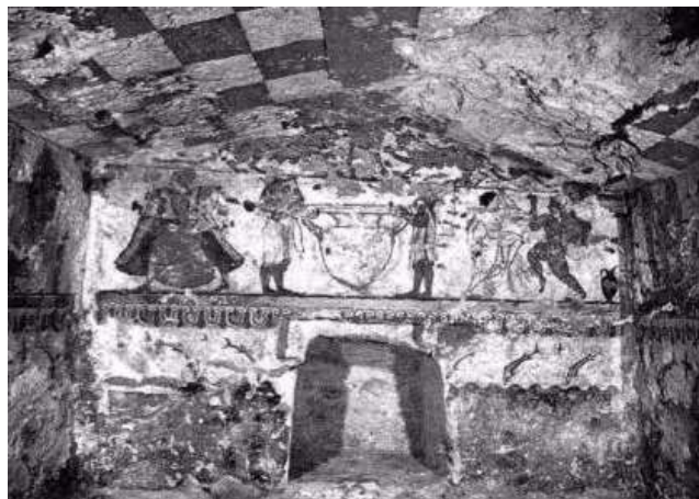
Tarquinia, a Nőstény oroszlánok kriptája. Az etruszk civilizáció legteljesebb hírei a megtalált néhány száz sírból származnak, ahonnan freskók, szobrok, különféle használati tárgyakra kerültek elő.

Ugyancsak keveset tudunk az etruszk társadalomról is: semmiféle olyan írott anyag nem maradt fenn, amelyből megtudhatnánk hány gazdag, szegény, nemes és rabszolga volt. Az egyetlen nyomot a festmények és a szobrok szolgáltatják: ezekből sejthetjük, hogy voltak urak, szolgák, bűvészek, zenészek, kézművesek, külföldiek (idegenek). Ugyanezekből megtudhatjuk azt is, hogy az etruszk nőknek ugyanolyan jogaik és méltóságuk voltak, mint a férfiaknak, ellentétben az ugyanabban a századokban élő görög nőkkel.